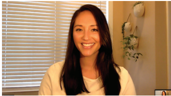
Limite la sobreexposición