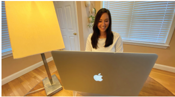
Use una lámpara detrás de la cámara