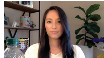
Despeje el desorden del fondo