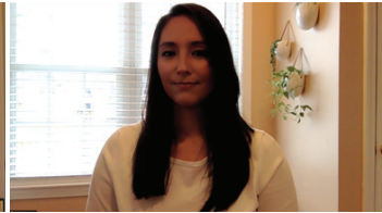
Cierre las persianas para reducir la luz brillante