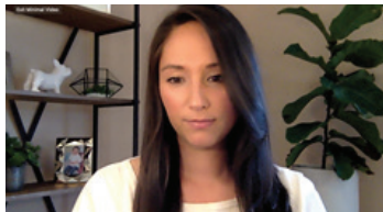
Mirar a la gente en la pantalla